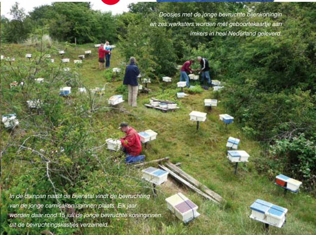
Doosjes met de jonge bevruchte bijenkoningin en zes werksters worden met geboortekaartje aan imkers in heel Nederland geleverd.