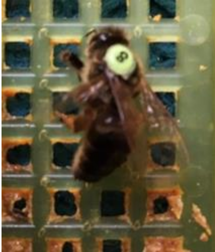
Afbeelding 4 Merkje geplaatst over de vleugels

Wanneer u ervoor kiest om de koninginnen van te voren te merken zorg er dan voor dat dit zorgvuldig gebeurt. We komen elk jaar koninginnen tegen die door verkeerd merken niet op bruidsvlucht gaan. Graag het nummer van het merkje invullen op de teeltkaart (mocht u dit bijvoegen).