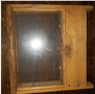
Afbeelding 1 glas volledig vrij van obstakels