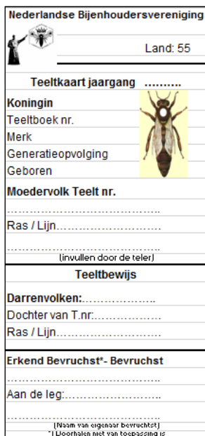
Afbeelding 5 Teeltkaart Vlieland

Wanneer de teeltkaarten niet duidelijk ingevuld zijn, kunnen wij ze niet voorzien van een stempel.