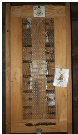
Afbeelding 3 Transportkisten met naam