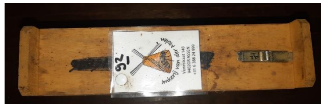
Afbeelding 2 naam eigenaar duidelijk zichtbaar